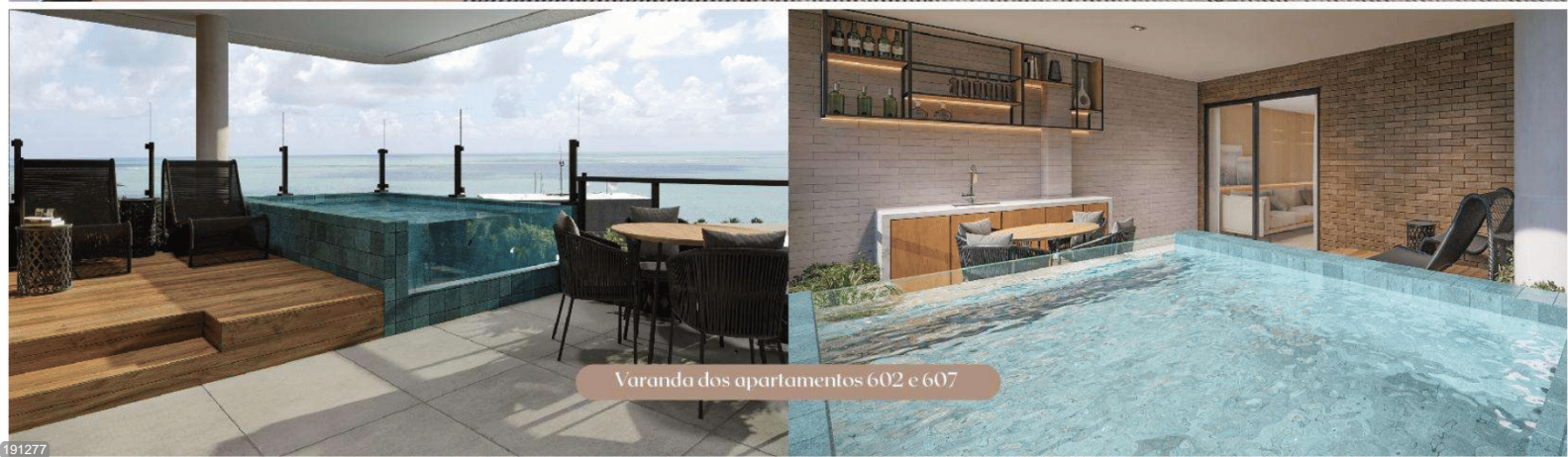
Varanda dos apartamentos 602 e 607